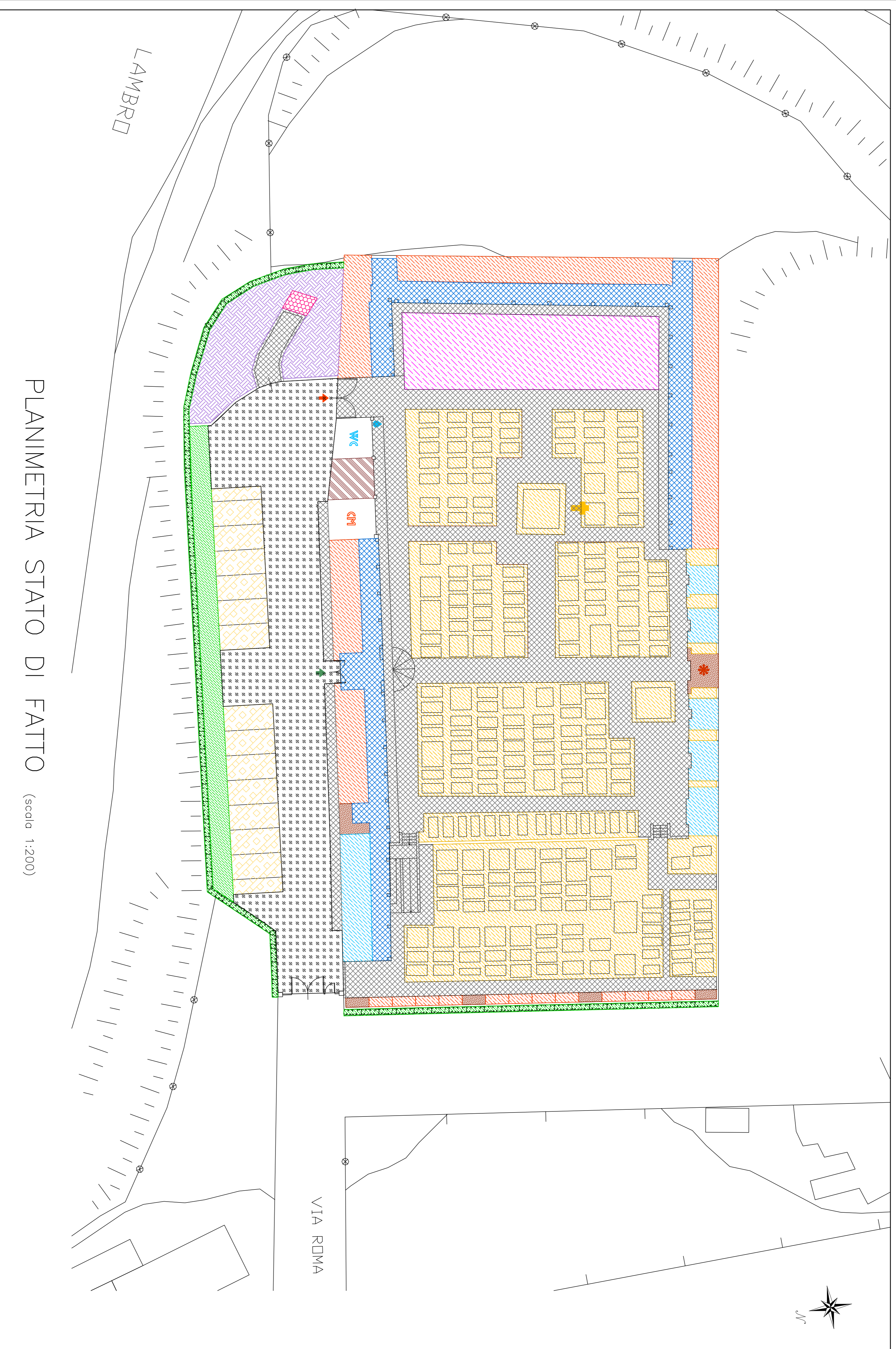
PLANIMETRIA STATO DI FATTO (scala 1:200)