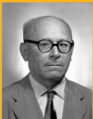
Umberto Terracini Presidente Assemblea Costituente