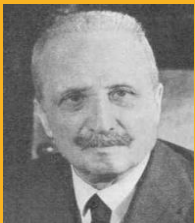
Enrico De Nicola Capo provvisorio dello Stato