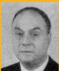
Giuseppe Grassi Ministro Guardasigilli