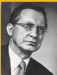
Alcide De Gasperi Capo del Governo