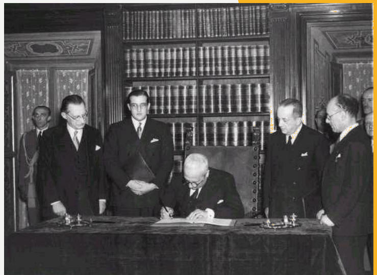
Il momento della firma e della promulgazione

Per rinnovare l'impegno a non dimenticare i valori di democrazia e di libertà, fondanti della nostra COSTITUZIONE